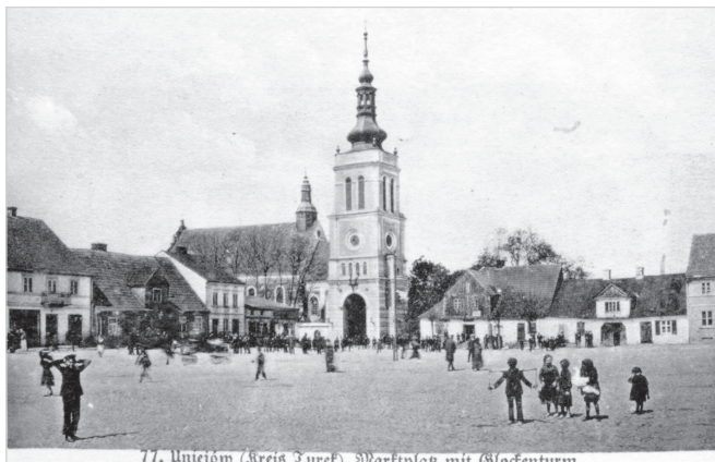
77. Uniejów (Kreis Turek), Marktplatz mit Glockenturm

Uniejów (powiat Turek), rynek wraz z dzwonicą