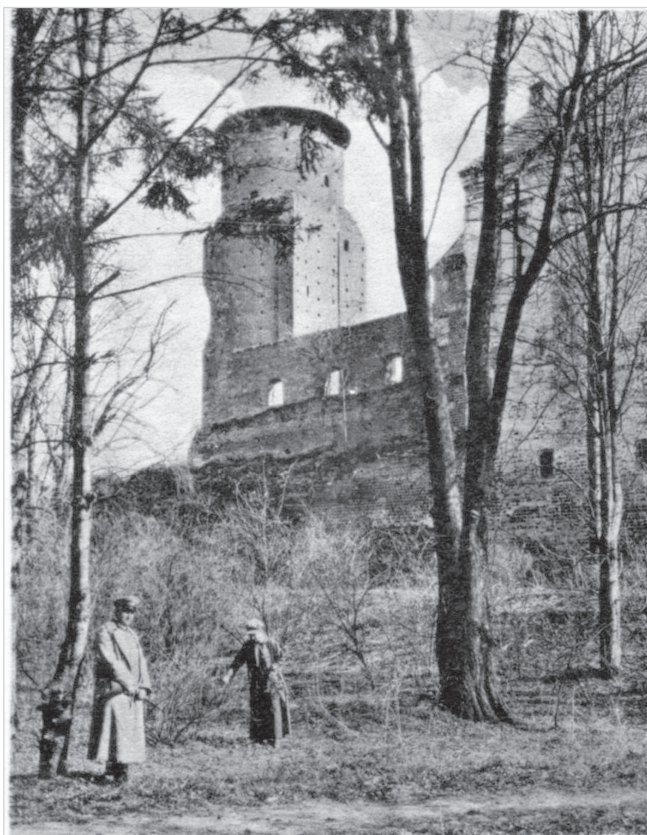
206. Uniejów (Kr. Turek), Schloßruine

Uniejów, wnętrze katolickiego kościoła farnego z grobem św. Bogumiła