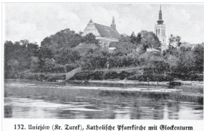
132. Uniejów (Kr. Turek), Katholische Pfarrkirche mit Glockenturm

Uniejów (powiat Turek), rynek wraz z dzwonicą